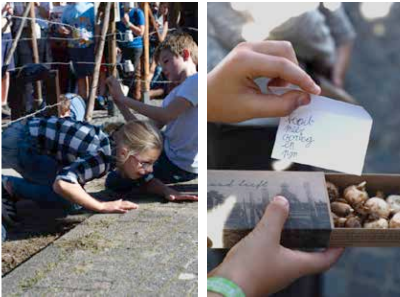
Koewacht: kinderen bij de reconstructie van de Dodendraad die hun dorp doormidden sneed.