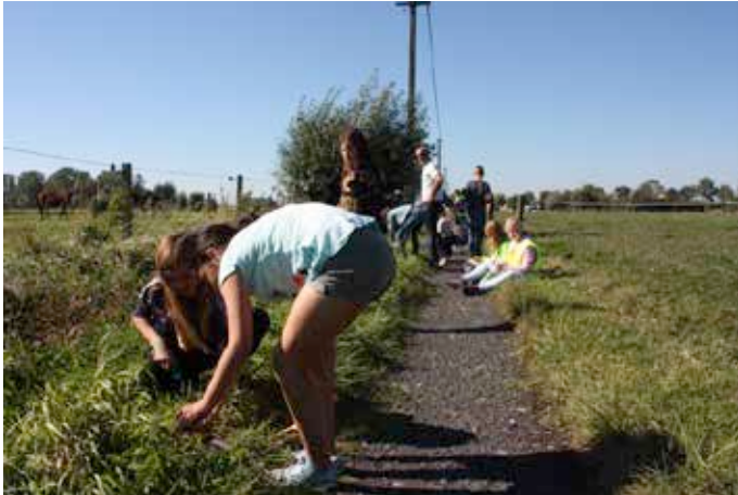
Schoolkinderen planten in Maldegem.

Er waren tal van randactiviteiten georganiseerd, zoals smokkelspelen en reenactments met Duitse en Nederlandse grenswachten in oude uniformen.