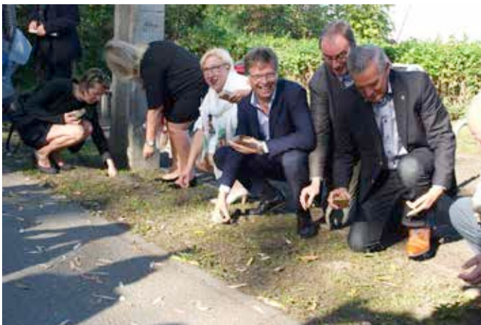
Zelzate: bij de start van de plantdagen langs de Zeeuwse grens, planten wethouders, gedeputeerden, burgemeesters en schepenen samen de eerste bolletjes.