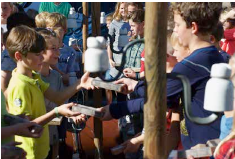
Koewacht: Belgische en Nederlandse schoolkinderen wisselen hun doosjes met krokusbolletjes uit aan de Draad – in ieder doosje hebben de kinderen een vredesboodschap verstopt.