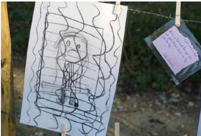
Zelzate: kindertekeningen opgehangen aan de reconstructie van de Dodendraad.

Er waren tal van randactiviteiten georganiseerd, zoals smokkelspelen en reenactments met Duitse en Nederlandse grenswachten in oude uniformen.