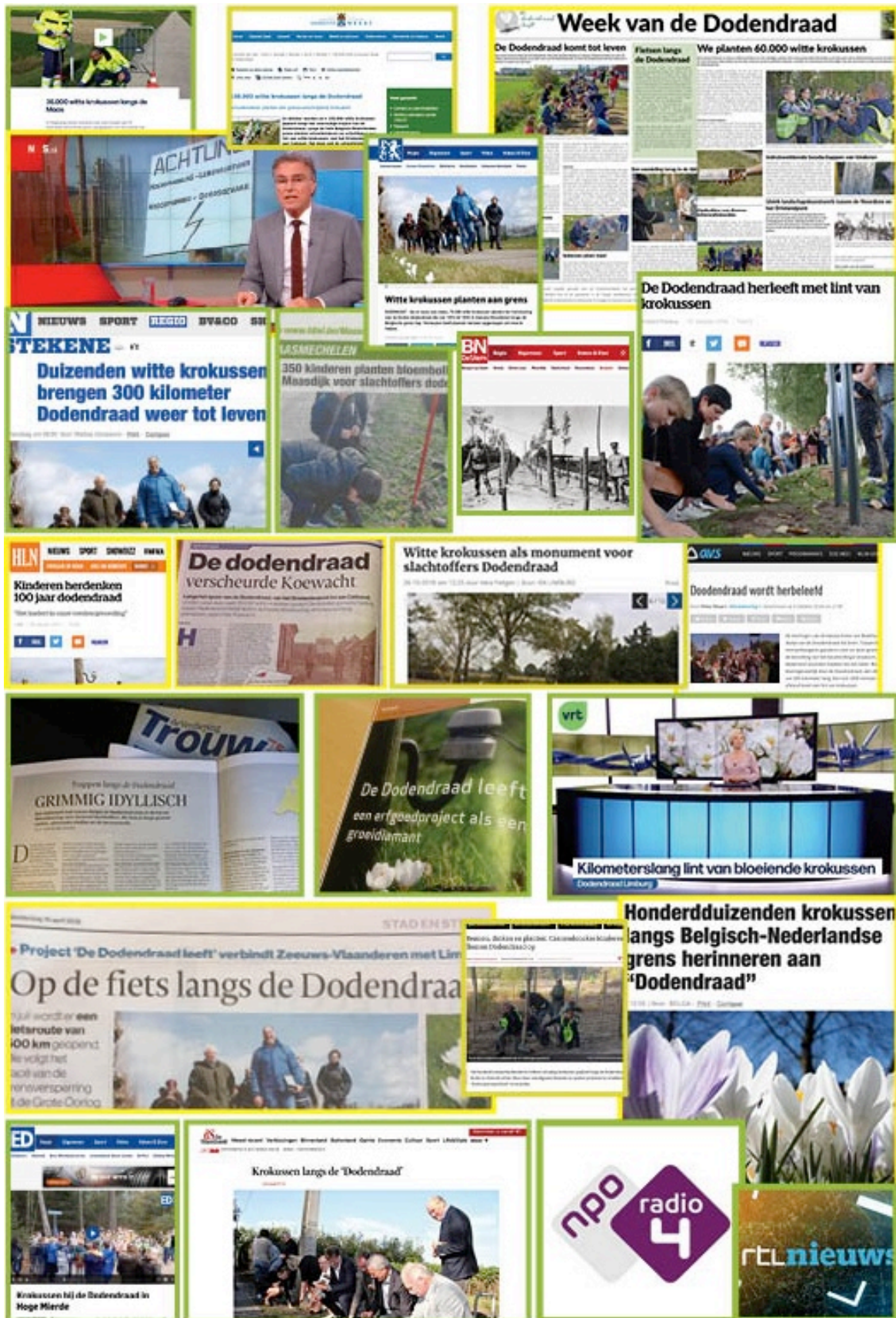
Een compilatie van artikelen in de pers over 'de Dodendraad leeft'.