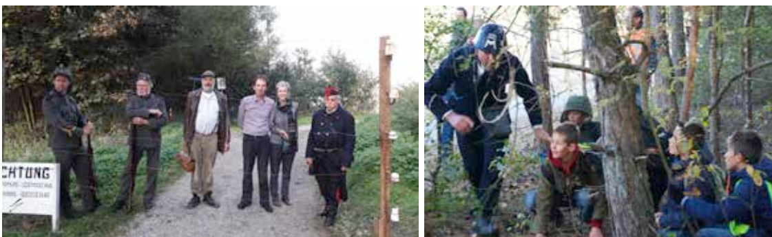
Reenactment in Sint Gillis-Waes en Hamont-Achel.