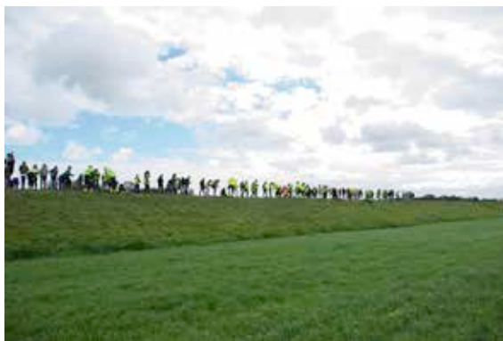
Plantende kinderen op de dijk bij Maasmechelen.

Maar liefst 28 gemeenten en met zo'n 3100 basisschoolleerlingen uit Nederland en België hebben we in oktober en november een lint geplant met 200.000 witte krokussen.