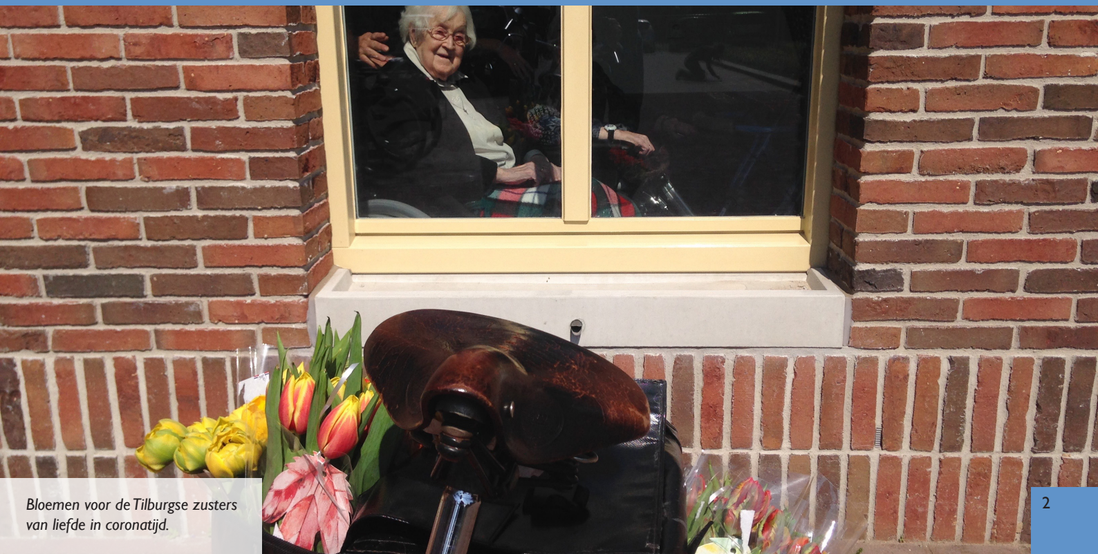
Bloemen voor de Tilburgse zusters van liefde in coronatijd.