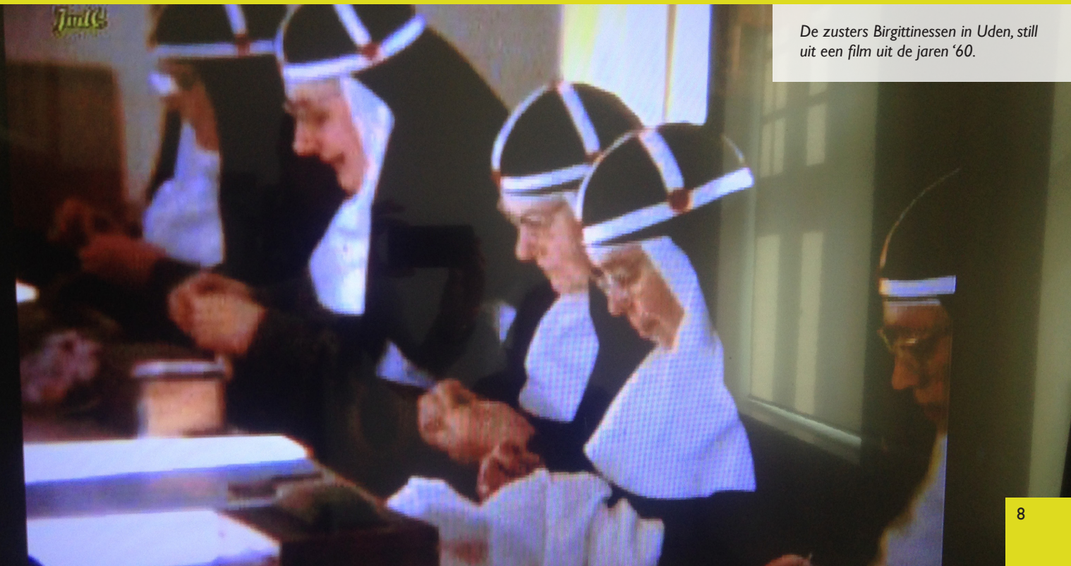
De zusters Birgittinessen in Uden, still uit een film uit de jaren '60.

We hebben voorgesteld in 2021 een filmfestival op diverse locaties in Brabant te houden met een selectie uit bestaande films over het Brabantse kloosterleven. Samen met Van Osch-films willen we dit volgend jaar realiseren.