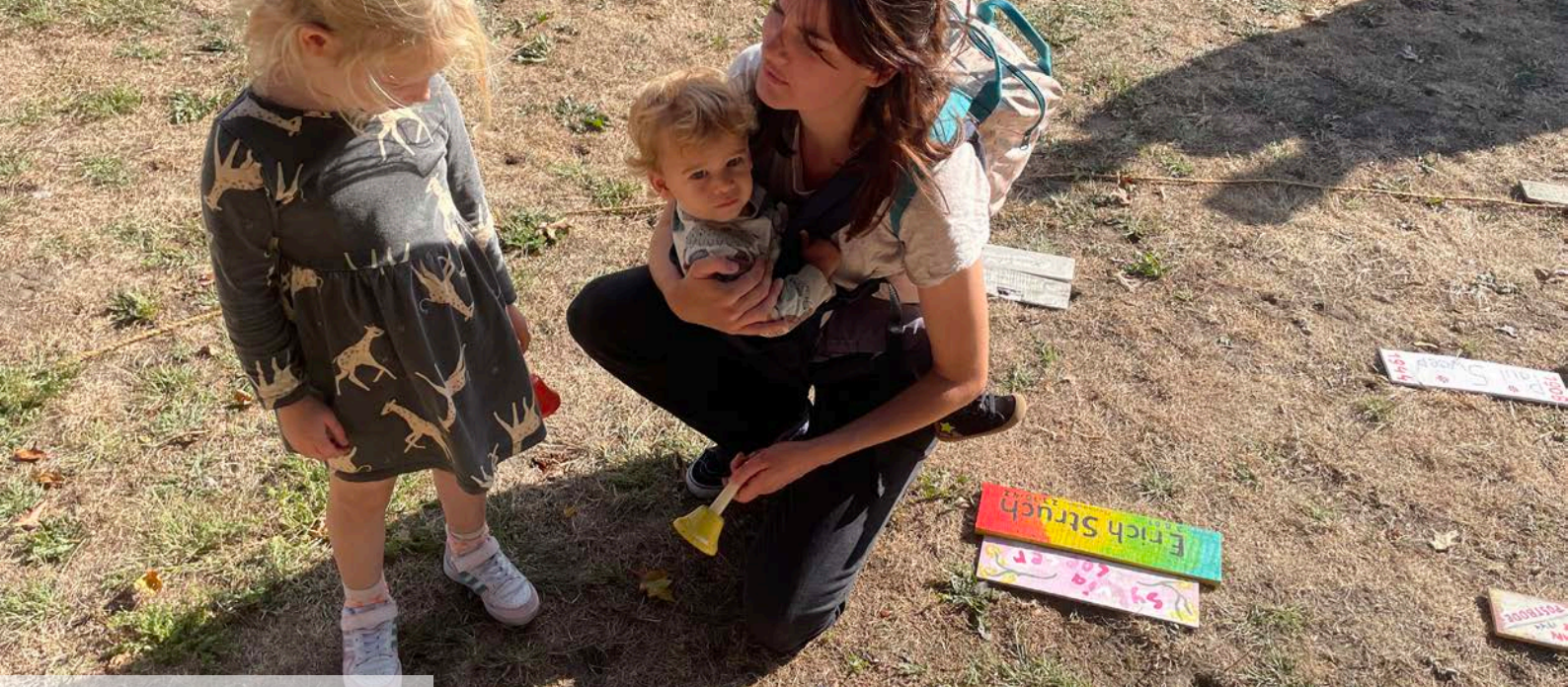
Bordjes neerleggen tijdens de herdenking in Breda op 3 september.