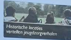
Historische locaties vertellen jeugdzorgverhalen

Het Burgerweeshuis werd in 1606 opgericht in een voormalig klooster. Het huidige gebouw dateert uit 1887. Bijzonder zijn de historische interieurs van de regenten- en regenteskamer, waarin de weeshuisbestuurders vergaderden. De regentenkamer heeft mooie houtwerkversiering en goudlederbehang. De kamer van de regentes heeft prachtige wandpanelen van de Bredase schilder J.H. Frederiks uit 1787, een voormalige weesjongen. Onder de oorspronkelijke naam 'T'Arm Kinderhuys En Het Arme Weeshuys Der Kercken Van Breda' steunt men nog steeds kinderdoelen.