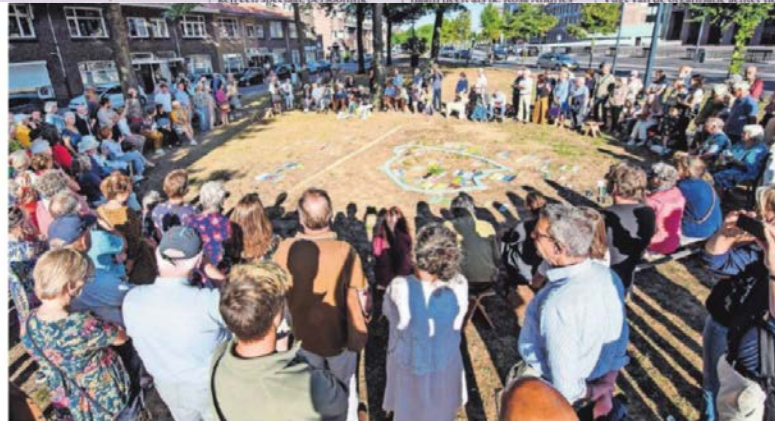
▲ De herdenking van de weggevoerde Joodse inwoners van Breda.