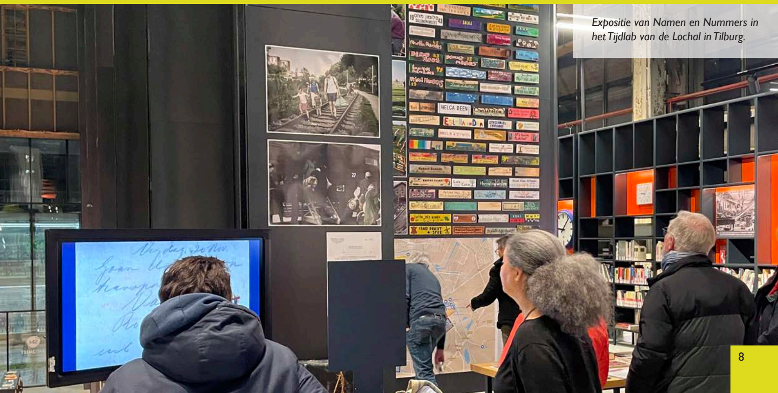
Expositie van Namen en Nummers in het Tijdlab van de Lochal in Tilburg.

De werkgroep Struikelstenen Oss bezocht de expositie en werd enthousiast om Namen en Nummers ook in Oss te organiseren. We begeleiden hen met diverse bijeenkomsten in de organisatie van die herdenking in Oss.